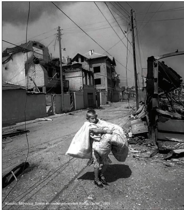
Kosovo, Mitrovica_Szene im niedergebrannten Roma-Viertel_ 1999