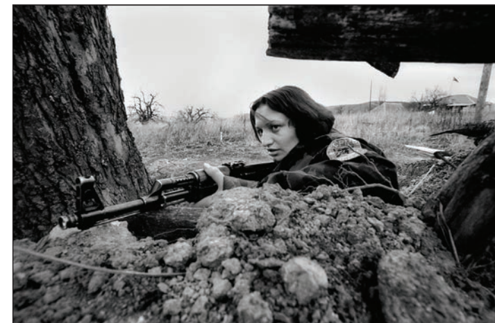
Serbien, Preshevo-Tal_ Frontstellung der radikalen UCPMB