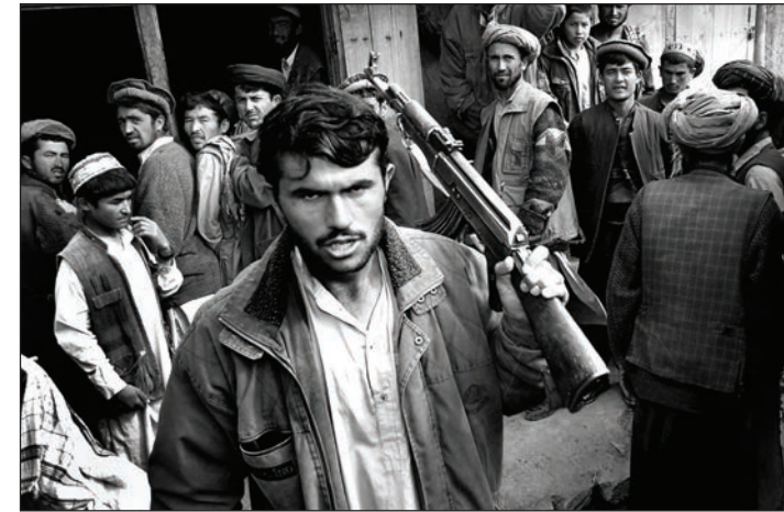
Afghanistan, Badakhshan_Milizionär im Drogenbasar von Argu_ 2008