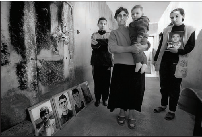
Kosovo Polje_Familie, deren männliche Mitglieder erschossen wurden_ 2000