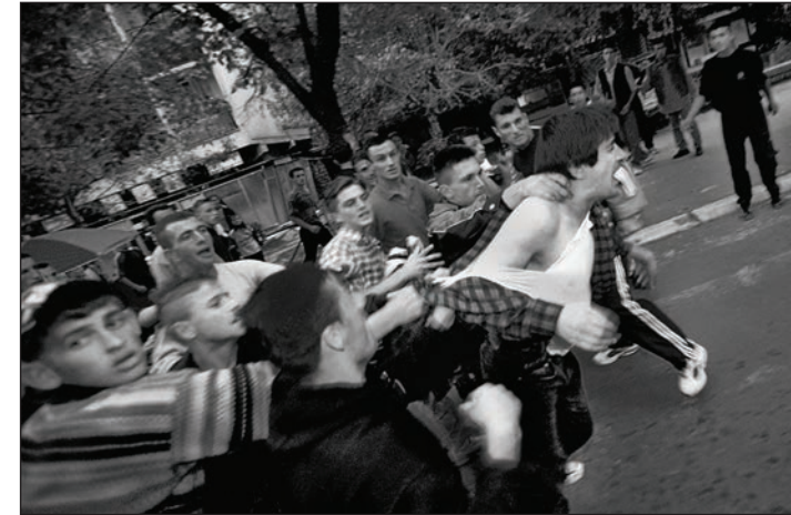
Kosovo, Pristina_Hetzjagd auf Serben_ 2000